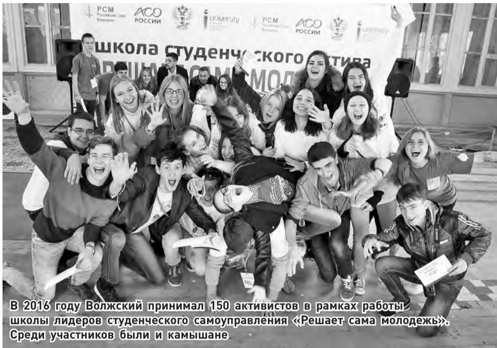
В 2016 году Волжский принимал 150 активистов в рамках работы школы лидеров студенческого самоуправления «Решает сама молодежь». Среди участников были и камышане

Руководство колледжа заботится не только о нашем интеллектуальном росте, но и физическом развитии. Поэтому каждый студент